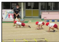
いろいろな運動遊び