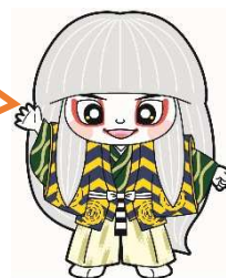
井原市マスコットキャラクター でんちゅうくん