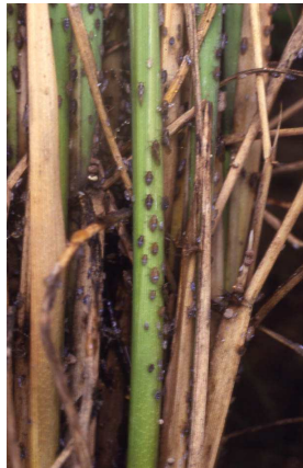
株元に集中して生息