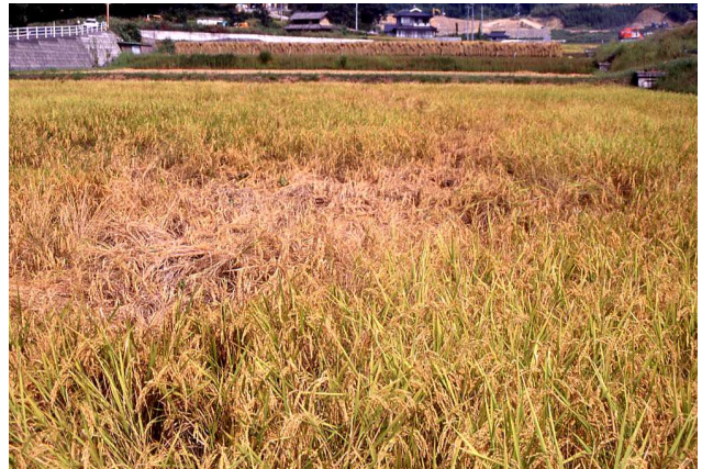
圃場の被害（坪枯れ）