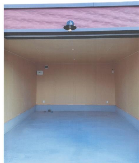
電動シャッター付部屋（20㎡）