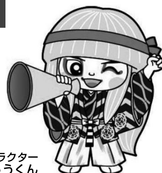
井原市マスコットキャラクター でんちゅうくん

本年10月に開催した公共交通会議では、本号でご紹介した公共交通の課題のほか、新たな計画の基本方針の案について様々な立場の方からご意見をいただきました。今後、いただいたご意見を参考に更に計画内容の具体化を進めていきます。また、次号の「公共交通かわら版」では、次期計画の方針や目標、今後実施していく事業等についてご紹介する予定です。