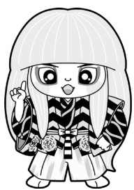
井原市マスコット キャラクター でんちゅうくん