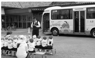
▲ バス体験学習会の様子

子どもたちにバスを親しんでもらい、バスの将来的な運行継続に向けた利用促進に繋げることを目的として、「バス体験学習会」を開催します。