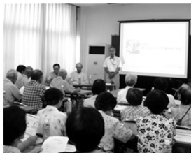
▲ 意見交換会の様子

公共交通の見直しや利用促進について、皆さまとともに考える意見交換会を開催します。