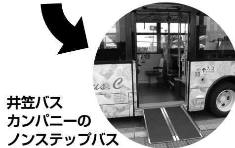
井笠バス カンパニーの ノンステップバス