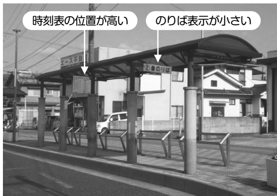
現在のバスのりば

具体的には、よりわかりやすい案内表示をめざし、各バスのりばの番号が遠くからでも一目でわかるよう大きく表示するとともに、現在高い位置に表示している時刻表を目線の高さに変更し、見やすくします。あわせて、駅の正面玄関前に設置している、のりば案内図のデザインを一新します。