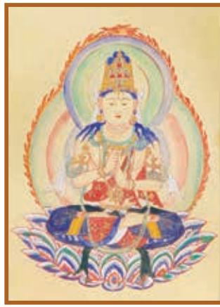
だいにちによらい 『大日如来』 仏画