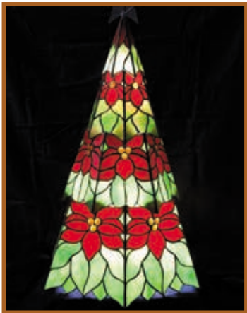
『ポインセチアの ライティングオブジェ』 スタンドグラス