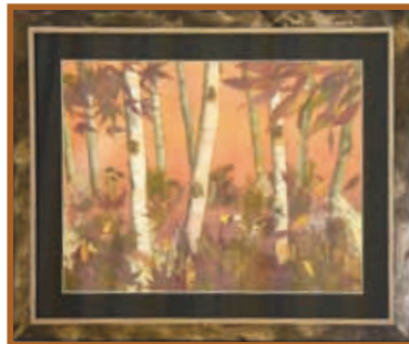
『茜色に染まった木々』 押花