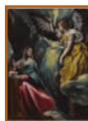
エル・グレコ 「受胎告知」