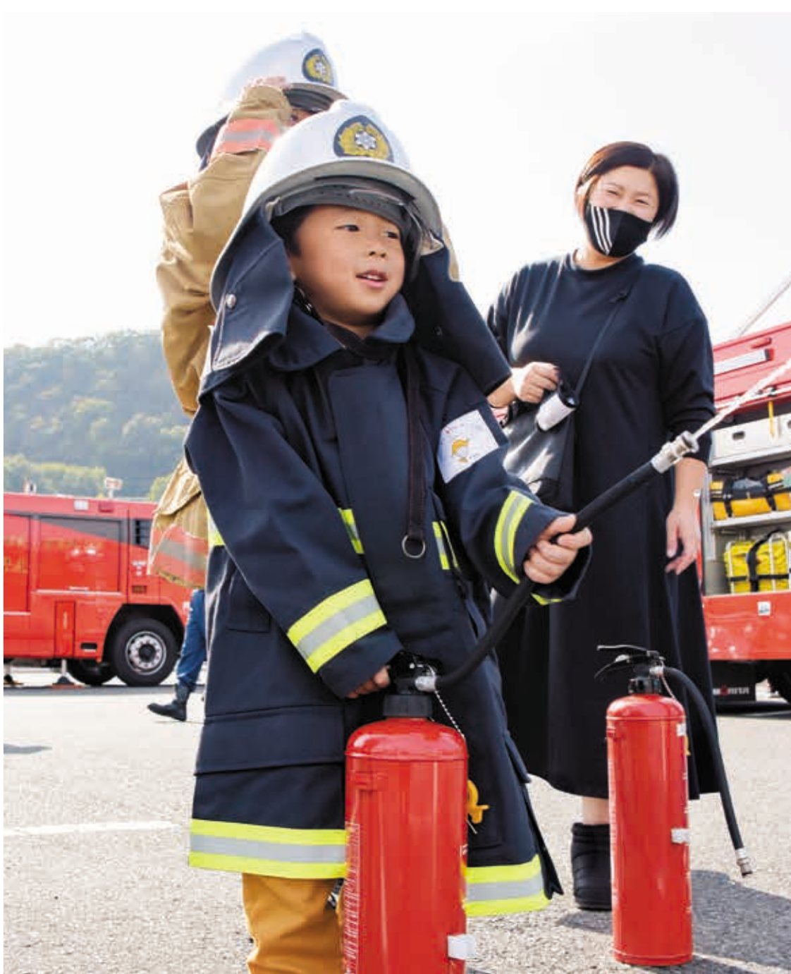
井原線DE得得市で、水消火器の訓練に挑戦する親子