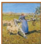
セガントーニ 「アルプスの真昼」