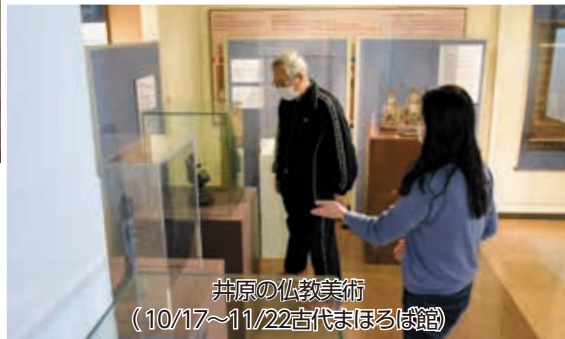
井原の仏教美術 (10/17~11/22古代まほろば館)