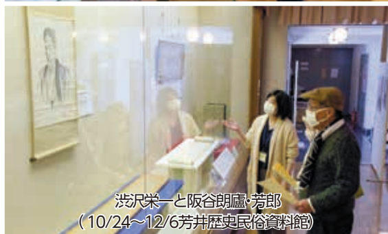
渋沢栄一と阪谷朗廬・芳郎 (10/24~12/6芳井歴史民俗資料館)