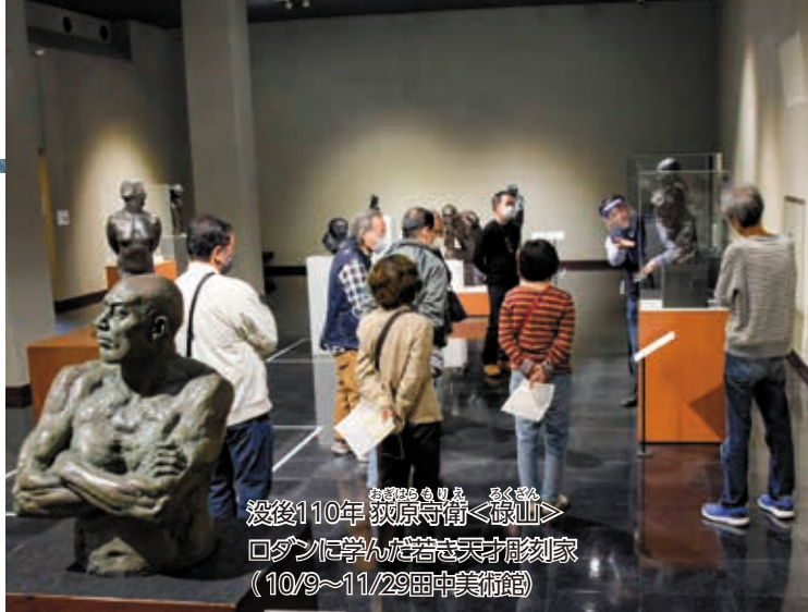
没後110年 源頼朝守衛<塚山> ロダンに学ぶんだ若き天才彫刻家 (10/9~11/29田中美術館)