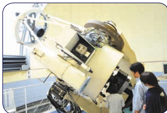
美星天文台 101cm 望遠鏡