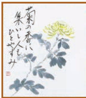
『菊香る』 水墨・淡彩画