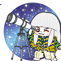
井原市 マスコットキャラクター でんちゅうくん