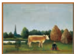
ルソー 「パリ近郊の眺め」 バニユー村