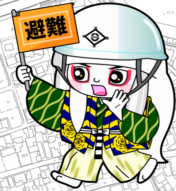
井原市マスコットキャラクター でんちゅうくん