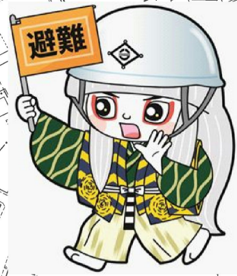
大曲井原市マスコットキャラクター でんちゅうくん

このハザードマップは、ため池の貯水量が満水の状態で堤体が全壊した場合を想定し、浸水範囲を計算した結果から、最大の浸水深を示したものです。なお、降雨による浸水や建物状況は考慮していません。 出雲池の総貯水量…13,800m 3