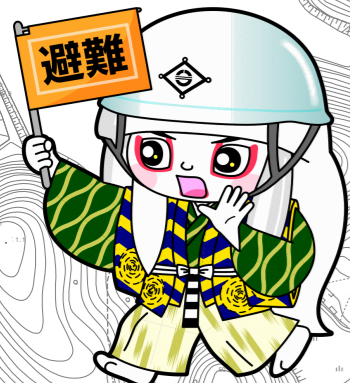
井原市マスコットキャラクター でんちゅうくん