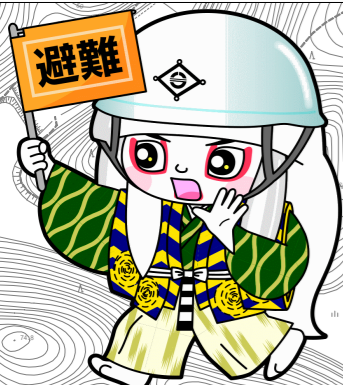
井原市マスコットキャラクター でんちゆうくん