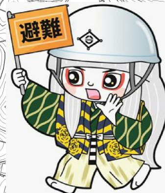
井原市マスコットキャラクター でんちゆうくん