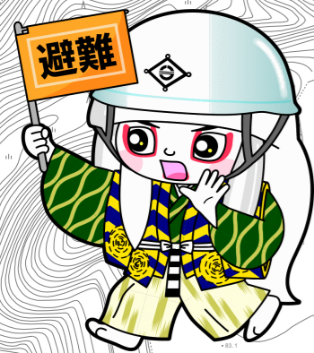
井原市マスコットキャラクター でんちゅうくん