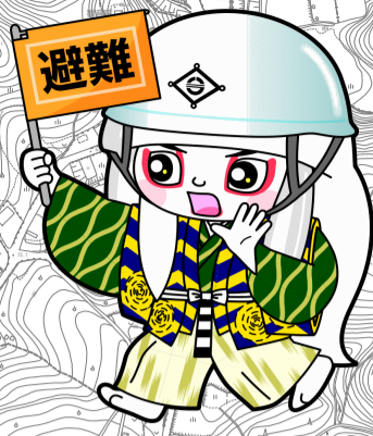
井原市マスコットキャラクター でんちゅうくん