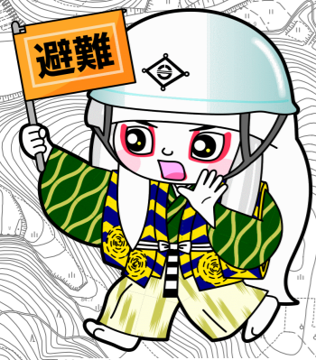
井原市マスコットキャラクター でんちゅうくん