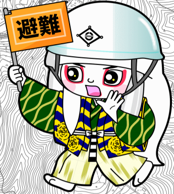
井原市マスコットキャラクター でんちゅうくん