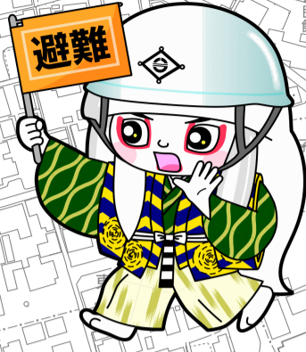
井原市マスコットキャラクター でんちゅうくん