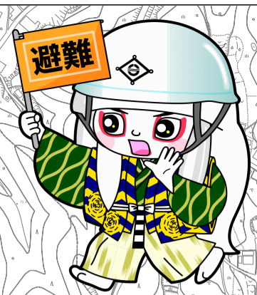
井原市マスコットキャラクター でんちゅうくん