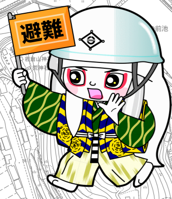
井原市マスコットキャラクター でんちゅうくん