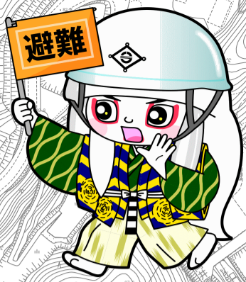
井原市マスコットキャラクター でんちゅうくん