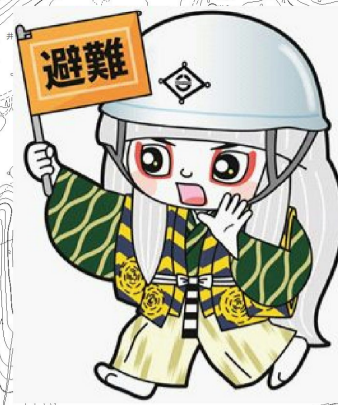
井原市マスコットキャラクター でんちゆうくん

このハザードマップは、ため池の貯水量が満水の状態で堤体が全壊した場合を想定し、浸水範囲を計算した結果から、最大の浸水深を示したものです。なお、降雨による浸水や建物状況は考慮していません。 鎌迫池の総貯水量…70,000m 3