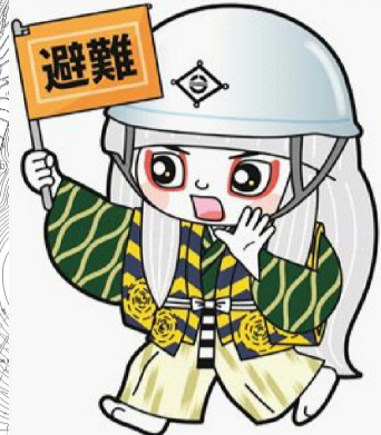
井原市マスコットキャラクター でんちゆうくん

このハザードマップは、ため池の貯水量が満水の状態ですべての堤体が全壊した場合を想定し、浸水範囲を計算した結果から、最大の浸水深を示したものです。なお、降雨による浸水や建物状況は考慮していません。 源造池の総貯水量…13,000m 3