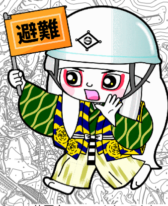
井原市マスコットキャラクター でんちゅうくん