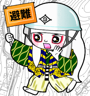
井原市マスコットキャラクター でんちゅうくん