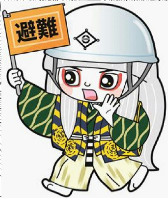
井原市マスコットキャラクター でんちゆうくん