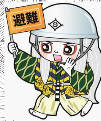
井原市マスコットキャラクター でんちゆうくん

このハザードマップは、ため池の貯水量が満水の状態にて堤体が全壊した場合を想定し、浸水範囲を計算した結果から、最大の浸水深を示したものです。なお、降雨による浸水や建物状況は考慮していません。 寺戸池の総貯水量…5,000m 3