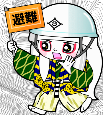
井原市マスコットキャラクター でんちゅうくん