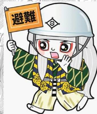
井原市マスコットキャラクター でんちゆうくん