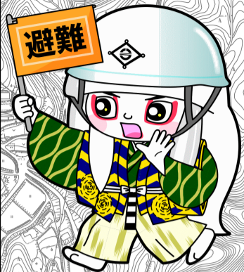
井原市マスコットキャラクター でんちゅうくん