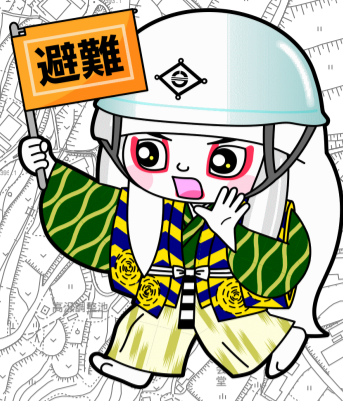
井原市マスコットキャラクター でんちゅうくん