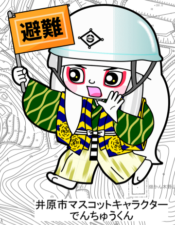
井原市マスコットキャラクター でんちゆうくん