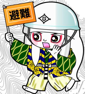
井原市マスコットキャラクター でんちゆうくん