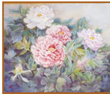
『五月のころ』 日本画 (F 20号)