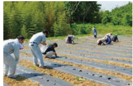
のがミーティング事業(野上地区)