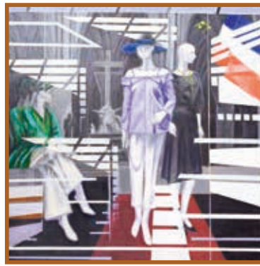
『ウインドーショッピング』 油絵 (S 20号)