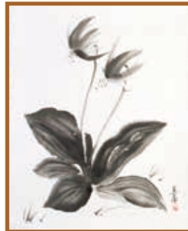
『五月の風』 水墨・淡彩画