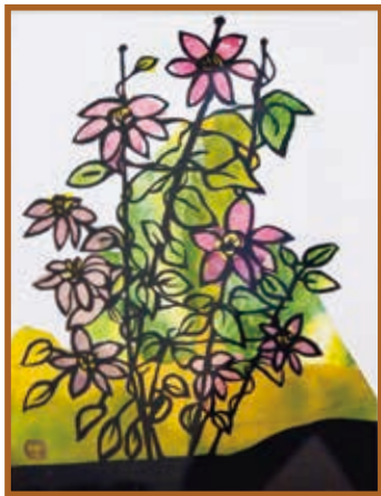
『クレマチス』 きりえ