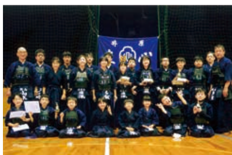
木之子剣道スポーツ少年団の皆さん

書籍などを頼りに栽培を続け、7年目に農家として独立。「物おじしない性格で百貨店にも自分で連絡して売り場を設けてもらい、自ら店頭に立っています。そこでお客さんと情報交換することお勉強になるし、励みになりますね。有機野菜は国の認証が必要で、毎年検査があつたり、思った収量が得られなかったりと大変なこともありますが、高校時代からの信念を持つて続けています。この地区は子どもがいなくなつて寂しいですが、いつかここで、子どもたちのために収穫体験などができたらいいなと思っています」