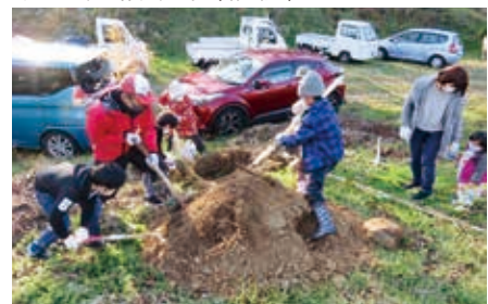
魅力発信事業(青野地区)

木之子町内活性化事業(継続)、きのこふれあい安心・安全ロード運動事業(継続)、木之子三世代交流グラウンドゴルフ大会(継続)