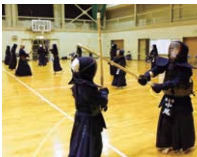
練習に打ち込む子どもたち

うれしいニュースが舞い 込みました。木之子剣道 スポーツ少年団が、令和 2年度少年剣道教育奨励賞 を受賞しました。40年以上 長きにわたって青少年の 健全育成および地域剣道の 発展・普及に尽力してきた ことに対して表彰された もので、県内では4団体が