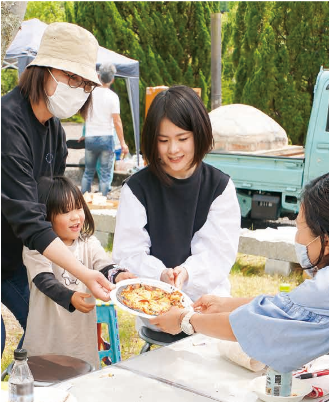
芳井町の「ニコニコてっぺんパーク」で、ピザの手作り体験をした地域の子ども