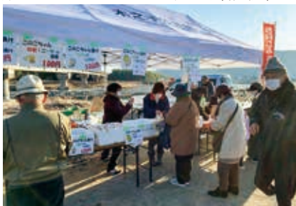
木之子町内活性化事業