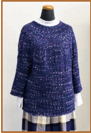
『ヨーク編みのセーター』 編物