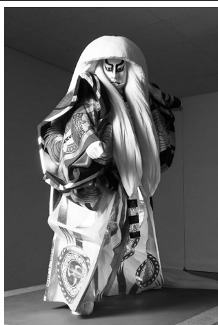
平櫛田中《鏡獅子》1958年 東京国立近代美術館蔵

昨年リニューアルオープンした平櫛田中美術館では、国立劇場の建て替えに伴い、令和6年2月から約5年半の予定で平櫛田中の代表作「鏡獅子」を展示しており、また、関連した企画展も開催しています。井原あいあいバスは日中の便数が充実しており、市中心部の移動に便利です。この機会にぜひバスを利用してお越しくください。