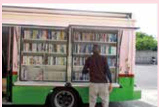
本日の1か所目に到着