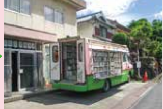
車幅ギリギリの場所も通るよ!