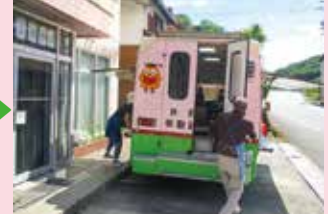
今日もたくさん借りました!