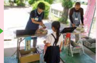
きちんと順番を守ってます!