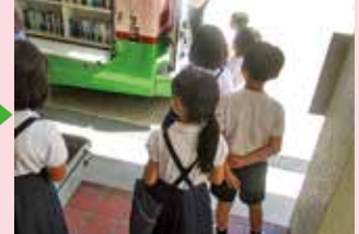
本日の訪問は終了