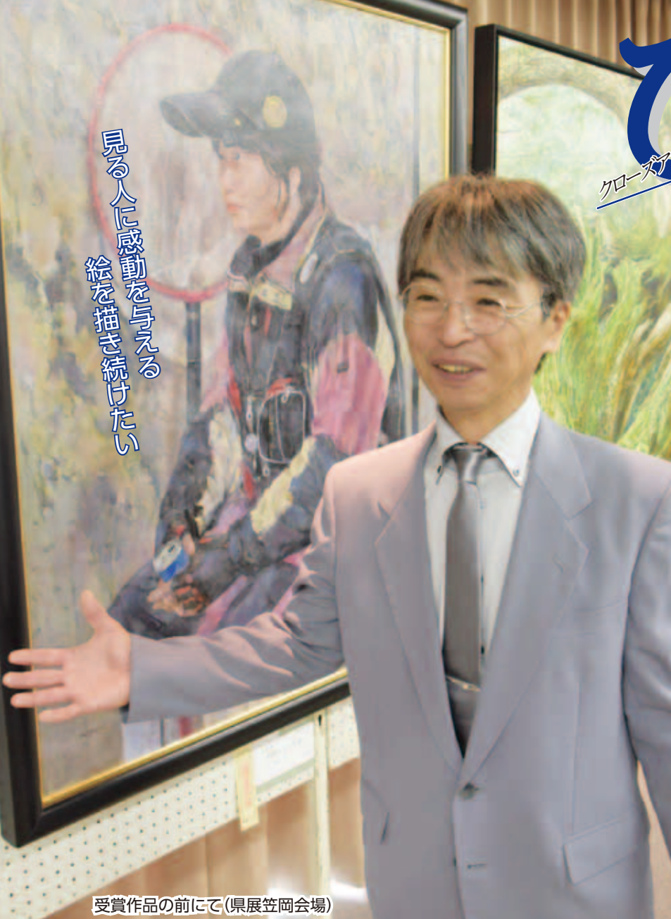
受賞作品の前にて(県展笠岡会場)