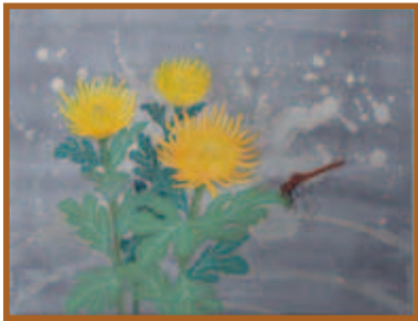
『菊と赤とんぼ』日本画(8号)

懐かしい銘仙 めいせん の着物地を、上衣とスカ ートのマチに使ったのがポイントです。