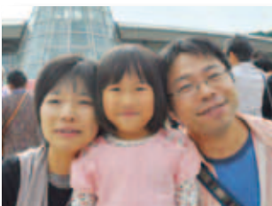
10/16 はつらつ井原 ふれあいフェスタ