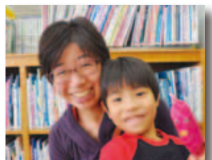
10/15 芳井図書館 おはなし会