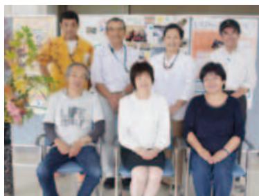
井原にほんご教室 ボランティアスタッフの皆さん

これは、市内や近隣で生活 勤務している外国人を対象 に、日常会話や日本語能力 検定の勉強を支援する教室 で、市内の主婦や会社員な ど6人のボランティアスタッ フが、市民活動センター