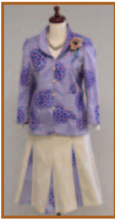
『着物リフォームのスーツ』洋裁