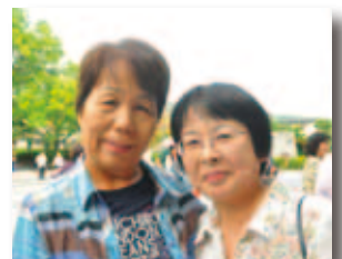
10/8 NHK俳句王国がゆく 公開収録