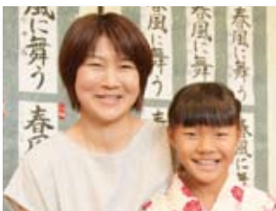
8/28 与一を偲ぶ古典芸能祭