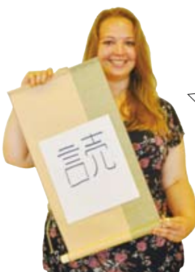
ブライオニー先生