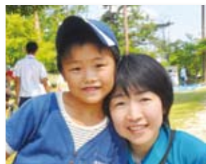
8/6 美星っ子夢フェスティバル