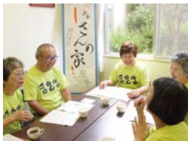
活動の打ち合わせをする 近所さんずのメンバー

このグループは、趣旨に賛同する有志8人が集まり今年3月に結成されたもので、親しみやすく人間味あふれる演技で人気を呼んでいます。劇は、孤独で頑固