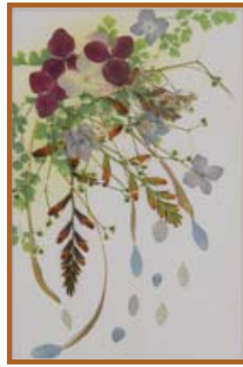
『アジサイの季節』押花