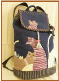
『リュック』パッチワーク