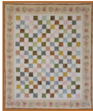
『お昼寝マット』パッチワーク