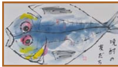
あじ 『鱈の干物』絵手紙