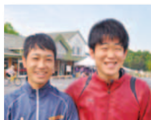
4/24 ぶどうの里 マウンテンバイク大会