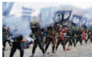
井原町伝承夢ロマン事業 (井原地区)