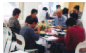
まちおこし活性化事業 (出部地区)

まちおこし活性化事業(継続・一部新規:43万4,000円)、まちおこし防災事業(継続:10万円)、広報活動による地域一体化事業(継続:32万円)