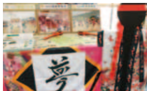
踊りでつなごう笑顔の“わ”事業 (稲倉地区)

「よみがえれ！自然豊かな稲倉の川」事業(継続・一部新規:30万円)、踊りでつなごう笑顔の“わ”事業(継続:30万円)