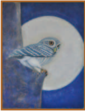
『月とフクロウ』日本画(6号)