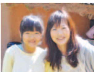
4/29 中世夢が原ゴールデン ウィークイベント