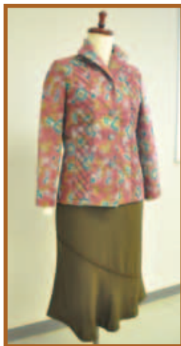
『ブラウスとスカート』洋裁