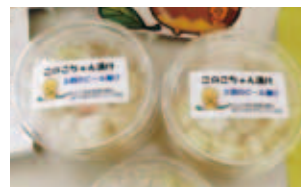
木之子町内活性化事業 (木之子地区)