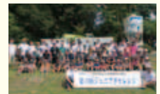
▲第3回ジュニアチャレンジ in櫛の杜事業