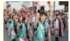
▲いきいき稲倉まちづくり協議会