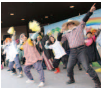
軽快に踊る 「明治で採れたごんぼう娘とその一座」

これは、芳井地区を中心 に活動する男女約20人の グループで、長靴や農作業用 帽子、腕カバーなどを身に 付け、芳井地区の各種イベ ントに登場し、元気な踊り を披露しています。 グループのリーダーで、