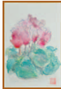
『シクラメン』はがき絵