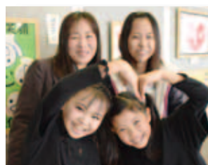
1/16 人権が尊重される まちづくりの集い