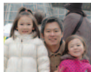
1/10 井原線ワンコインデー