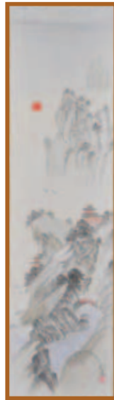
『連峰山』水墨・淡彩画