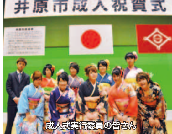
成人式実行委員の皆さん