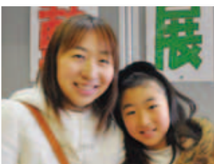
1/31 まなびフェスタ inいばら