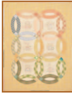
『ベビーキルト』パッチワーク