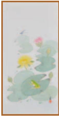
『睡蓮にかえる』水墨・淡彩画