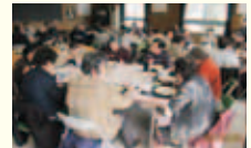
▲荏原地区まちづくり協議会