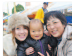
12/6 明治ごんぼう村 フェスティバル