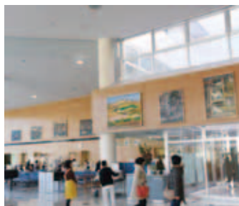
絵画が飾られた総合受付

現代では、生まれてから亡くなるまでの間に、ほとんどの人が利用する病院。患者や家族は、傷の痛みや病気などへの不安を抱えながら治療に取り組んでおられ、痛みや不安は、利用者の心に精神的なストレスを与えています。こうしたストレスを軽減し、利用者の療養環境を