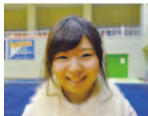
12/6 新体操フェスティバル