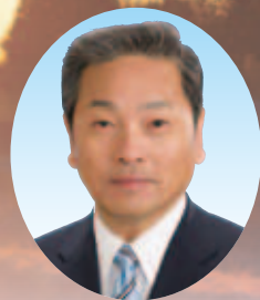
井原市長 たきもと とよ ふみ 瀧本 豊文