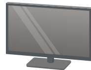
●液晶 ディスプレイ