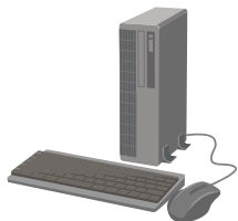
●デスクトップパソコン (本体)