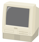
●CRTディスプレイ 一体型パソコン