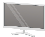
●液晶ディスプレイ 一体型パソコン