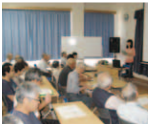
歴史に学ぼう事業 (大江地区)

青野自然環境保全事業(継続:21万7,000円)、青野情報発信事業(継続:69万7,000円)、青野健康推進事業(継続:8万6,000円)