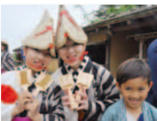
5/3 中世夢が原 GWイベント