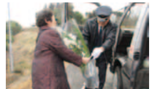
「生活の足」対策事業 (野上地区)