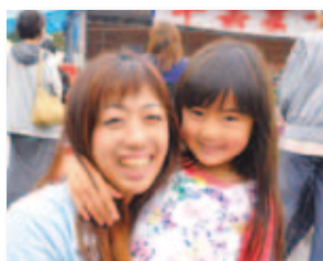
4/19 井原市北条早雲まつり