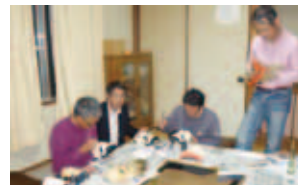
神楽面づくりによる地域活性化事業 (出部地区)