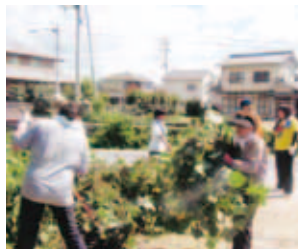
神戸川を活かしたともに生きる事業 (西江原地区)