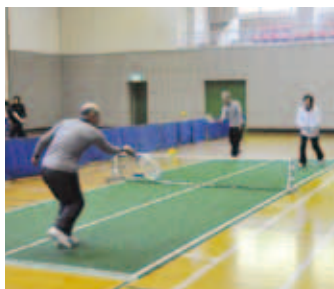
バウンドテニスの練習風景

これは、テニスによく似た ルールで、狭い場所でも手軽 にでき、運動量も十分にある スポーツとして、昭和55年に 日本で考案されたものです。 コートの大さはテニス コートの約6分の1で、テニス ラケットを小さくした形の