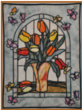
『はなとちょう』 パッチワーク