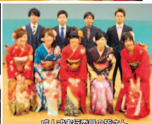
成人式実行委員の皆さん