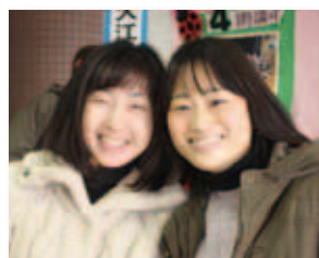
1/25 まなびフェスタ inいばら