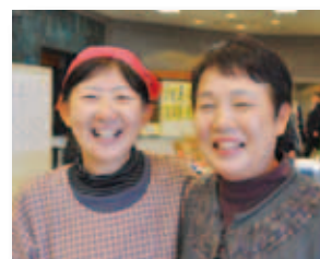
1/17 人権が尊重される まちづくりの集い