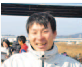
1/25 晴れの国岡山 駅伝競走大会