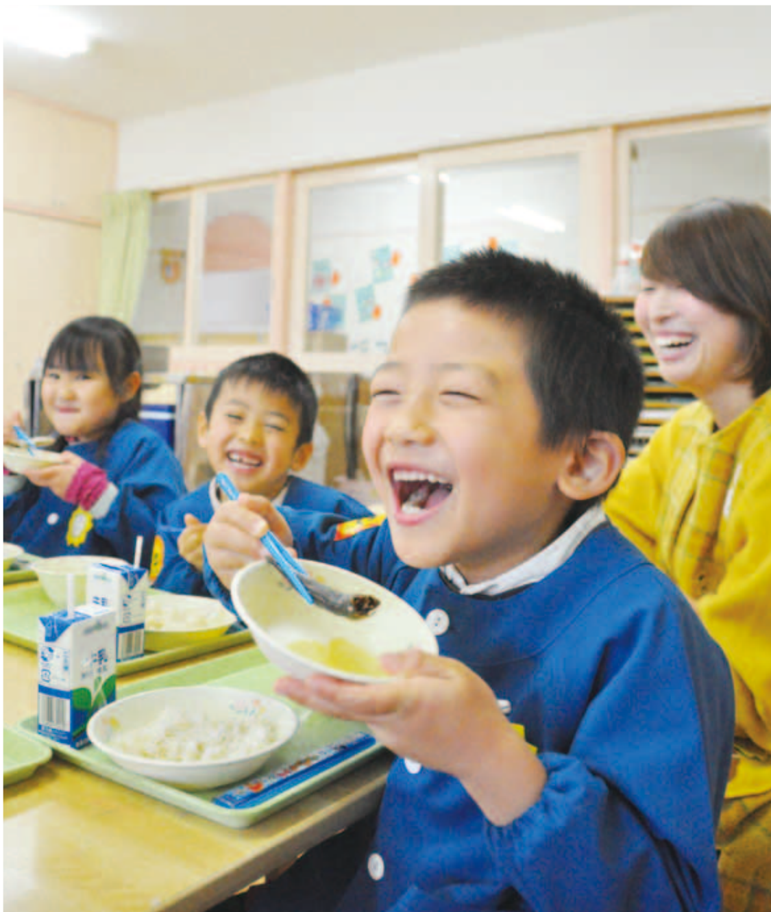
笑顔で給食を食べる西江原幼稚園児。