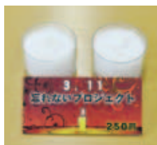
井原駅のThe BOX などで販売中の 「忘れないキャンドル」

高校卒業後、三重県の実業団で陸上競技を続ける予定の竹内さん。「所属先は、若い人が多く、伸び盛りのチームだと聞いています。陸上は野球とは違い、個人の頑張りで結果の出るスポーツです。まだまだ未熟者なので、自分に厳しく練習を続け、将来は毎年元日に行われる全日本実業団駅伝のメンバーや、東京オリンピックのメダルが取れるような選手になりたいです」