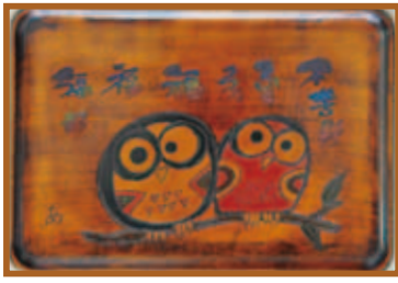
『福福ふくろう』木彫