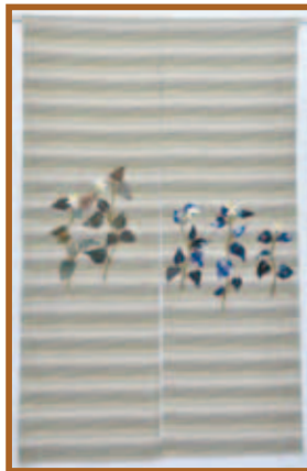
『のれん』パッチワーク

段染め糸で地模様 じもよう にチャレンジ。編み 上がりの達成感 だんせ は最高でした。