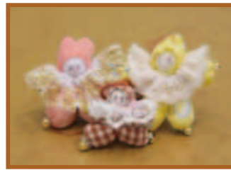
『ピエロ三姉妹』手芸