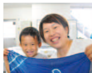
7/23 文化財センター 講座染物体験