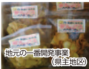
地元が一番開発事業 (県主地区)

広報紙発行事業(継続)、「ふるさとかかし」「かかしコンテスト」による地域活性化事業(継続)、地元が一番開発事業(継続・一部新規)