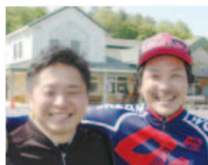
4/30 ぶどうの里 マウンテンバイク大会