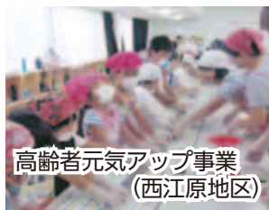
高齢者元気アップ事業 (西江原地区)