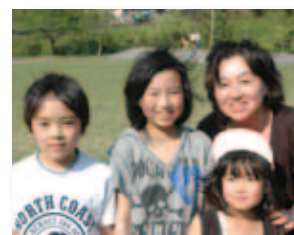
4/30 井原リフレッシュ公園