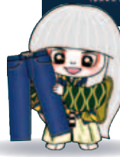
井原市 マスコットキャラクター でんちゅうくん