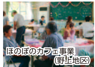
ほのぼのカフェ事業 (野上地区)