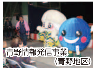
青野情報発信事業 (青野地区)

青野自然環境保全事業(継続)、青野情報発信事業(継続)、青野健康推進事業(継続)