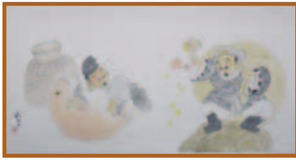
『恵比須大黒天』水墨・淡彩画