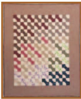
『ひざかけ』パッチワーク