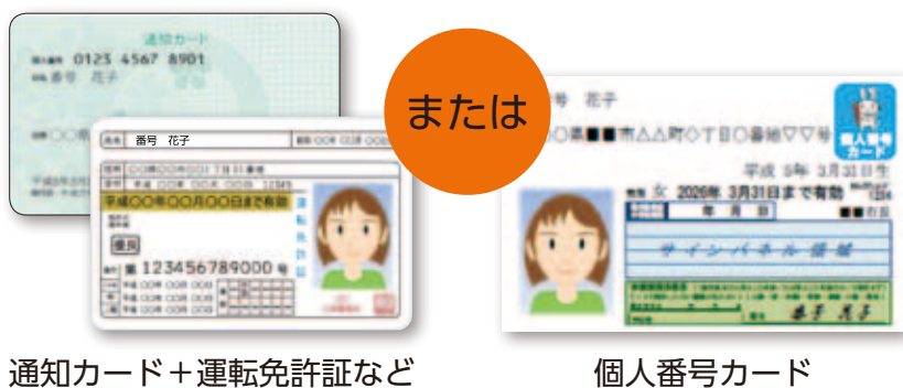
通知カード+運転免許証など