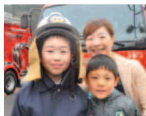
12/4 井原地区 防火の集い