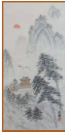
『宝来山』水墨・淡彩画

正月らしい、めでたい山を描きました。もっと 上達して、もう一度挑戦してみたいです。