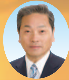
井原市長 たきもと とよ ふみ 瀧本 豊文