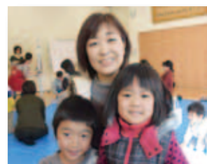
12/3 出前児童会館 (大江公民館)