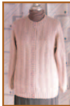
『初めての手編カーディガン』編物