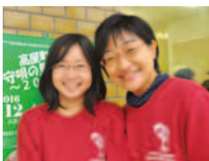
12/4 高屋町子守唄の里 音楽祭