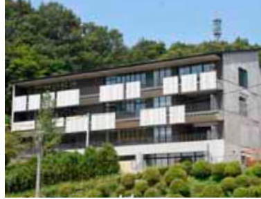
▲井原中学校特別教室棟