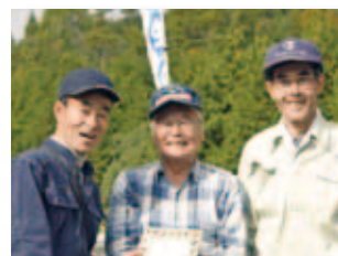
11/17 おかやま共生の森・井原 「保育のつどい」