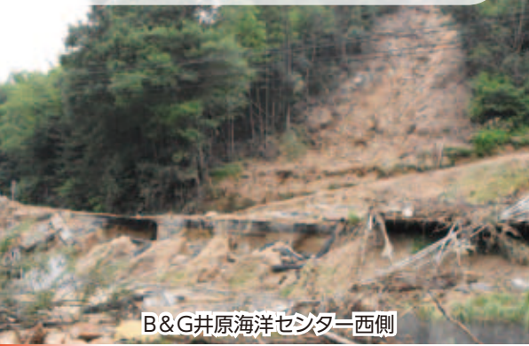
B&G井原海洋センター西側