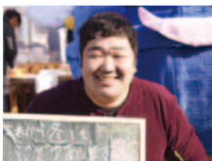
11/25 あたごっち大作戦