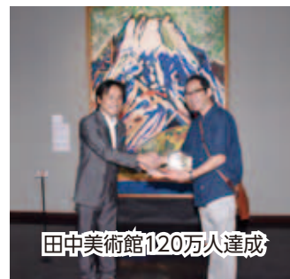
田中美術館120万人達成