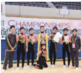
優勝杯を手に喜ぶメンバー

大会では、2連覇中の強豪 チームが先に高得点をたたき 出す中、重圧を感じさせない 演技を繰り返し、僅差で逆転 しました。