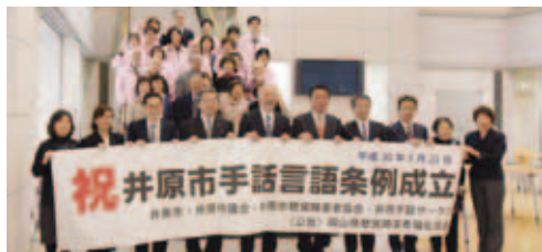
▲手話言語条例成立