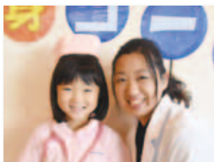
11/18 市民病院 健康まつり