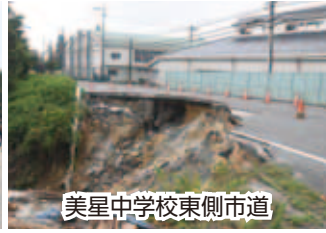
美星中学校東側市道