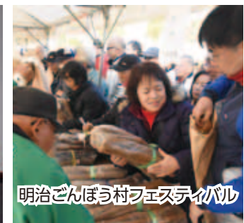
明治ごんぼう村フェスティバル