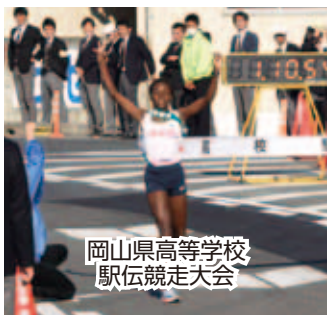
岡山県高等学校 駅伝競走大会