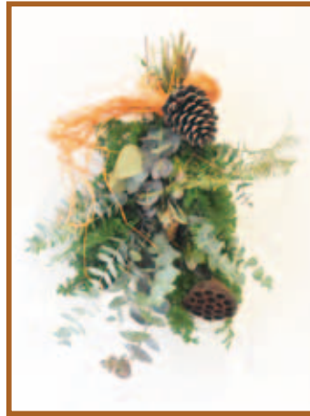
『クリスマスの ドアスワッグ』 フラワーアレンジメント