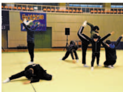
続く舞台に向けて練習に励む

高校を卒業し、この11月には全国青年弁論大会一般の部に出場。「全国優勝した昨年の内容に磨きをかけて臨みましたが、入賞することはできませんでした。参加者は40歳までと年齢層も幅広く、人生経験が豊かな人が多いため、高校生の大会と比べて弁論の内容が深いと感じました。私は子どもが大好きで、保育士になる夢をかなえるために勉強中です。今後は、子どもとの関わりなど、私なりの経験を積んで、その中で気付いたことをテーマに、全国の舞台上に再度チャレンジしたいと思っています」