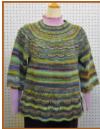
『ヨーク入りセーター』編物