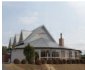
星の郷アクティブヴィラ ▲ (ペンションコメット) リニューアル ▶