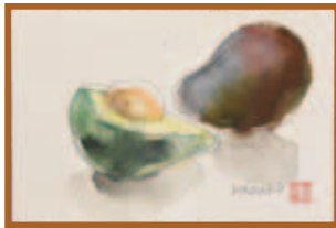
『アボカド』はがき絵