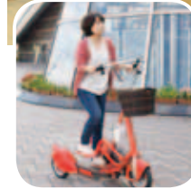
◀ウォーキング バイシクルの レンタル開始