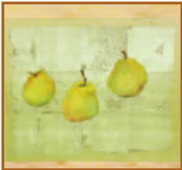
『ラ・フランス』日本画(8号)