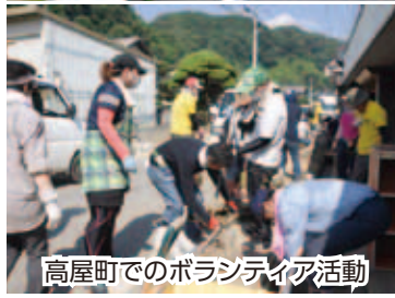
高屋町でのボランティア活動