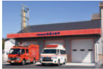
▲井原消防署美星分駐所移転