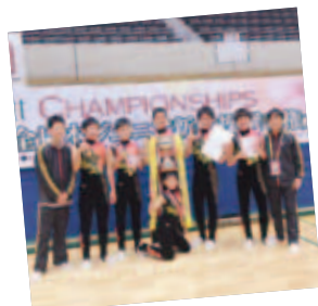
▲全日本ジュニア新体操優勝