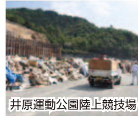
井原運動公園陸上競技場